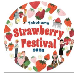
イベントオリジナルステッカーイメージ

「ランドマークプラザ」、「横浜ワールドポーターズ」、「横浜ハンマーヘッド」、「マリナード ウォーク ヨコハマ」の近隣商業施設とも連携し、ストロベリーフェスティバルを開催。施設ごとにこの時期だけのいちごメニューなどをご用意しました。また、「インターコンチネンタル横浜 Pier 8」、「ウェスティンホテル横浜」、「ヒルトン横浜」、「ザ・カハラ・ホテル&リゾート 横浜」、「ローズホテル横浜」の横浜・みなとみらいエリアのラグジュアリーホテルでもこの時期限定のいちごメニューなどを展開し、近隣一帯がいちご色に染まります。さらに、「横浜アンパンマンこどもミュージアム」ではイベント入場チケットを提示することでベビーカーがもらえるなどの連携キャンペーンも実施し、親子で一緒に“いちご”をお楽しみいただけます。