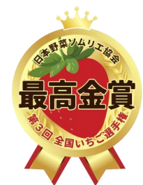
「第 3 回全国いちご選手権」 最高金賞ロイイメージ

いちご業界大注目！日本唯一、全国規模のいちご品評会「全国いちご選手権」初となる表彰式が、今年「Yokohama Strawberry Festival 2025」会場内で開催されます。全国各地からエントリーされたいちごの中から、評価員である野菜ソムリエが産地や品種、生産者などの情報をすべて伏せて食味。そのおいしさを事前に審査し、最もおいしい『春いちご』を称える表彰式が行われます。