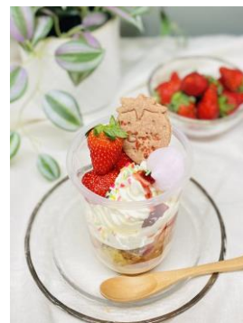
オリジナルパフェづくりイメージ