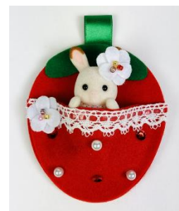
シルバニアファミリー ワークショップイメージ