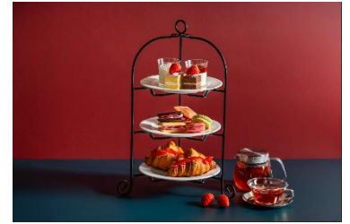
アフタヌーンティーイメージ

いちごを使ったスイーツやドリンクを提供する、いちごスイーツ専門店「いちびこ」の特設カフェエリアがイベント初登場！旬の「ミガキイチゴ」を使用した、ショートケーキやクロワッサンサンド、パンナコッタなどで彩られた、ここでしか食べられないスペシャルアフタヌーンティーをご提供します。「いちびこ」としても、本イベントとしても、アフタヌーンティーのメニューをご提供するの初となります。貴重な機会にぜひお召し上がりください。