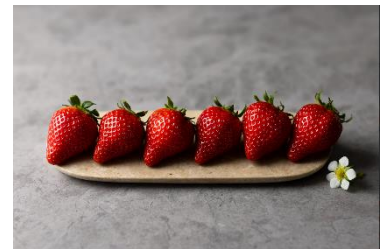
提供品種イメージ（ミガキイチゴ）