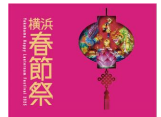
横浜春節祭 2025 ロゴ

今年も開催する、横浜中華街の春節を横浜ベイエリア全体でも楽しめるイベント「横浜春節祭 2025」ともコラボが決定。本場・中国の春節の雰囲気味わえるランタンオブジェを本イベント会場内に展示します。今年新たにストロベリーフェスティバルと特別にコラボした、“いちご型のランタンオブジェ”は写真に納めたいこと間違いなし！