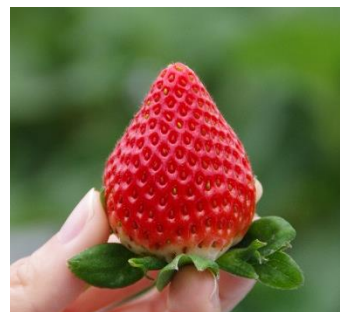
ブランドいちご一例